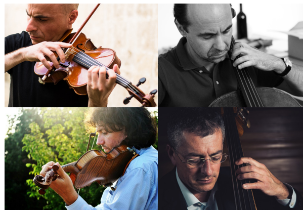
I Solisti di Contempoartensemble