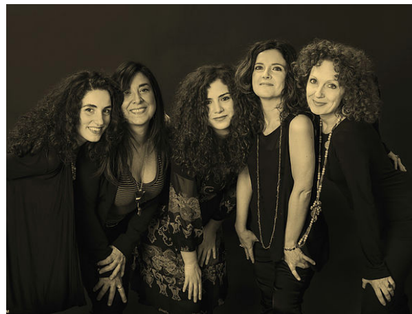
Il Quinto Elemento